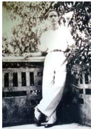
Hình 1. Nguyễn Nhược Pháp