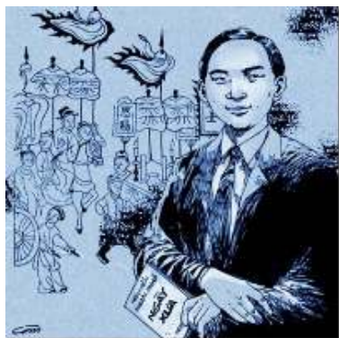
Hình 2. Cầm tay tập Ngày Xưa của Nguyễn Nhược Pháp

Qua mười bài thơ trong tập Ngày Xưa (mà bài nổi tiếng nhất, “Chùa Hương,” đã được phổ nhạc bởi nhạc sĩ Trần Văn Khê), ta được đưa vào một thế giới của huyền thoại, của tình yêu, của một quá khứ xa xôi mà các tân khoa, sau khi yết băng, được vua cho đi thăm hoa, có lọng đưa, được các nàng trâm anh từ lầu gieo cầu ngũ sắc chọn ý trung nhân.